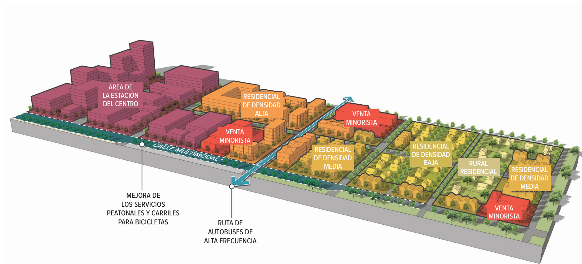
Este gráfico y el diagrama de la página siguiente resaltan los conceptos clave de forma y paisaje urbanos concebidos para la Alternativa 2.

Esta alternativa concentra viviendas, empleos y destinos comunitarios a lo largo de corredores clave y en centros comunitarios. Esto incluye tanto nodos de Centros Comerciales (centros comerciales y de servicios de mayor tamaño) como de Centros Vecinales (minoristas más pequeños). Casi todos los residentes tendrían acceso conveniente a muchas necesidades diarias a poca distancia a pie o en bicicleta, lo que reduciría la necesidad de la mayoría de los viajes diarios en vehículo o autobús por la ciudad.